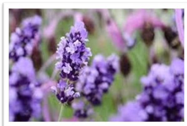
Een fleurig en warm welkom bij De Es

Bewoners hebben niet alleen een mooie gang ze kunnen ook herinneringen ophalen aan lange vakanties in Zuid Frankrijk of strandwandelingen met hun geliefden. Ook zijn er op diverse gangen nu mooie groentakken aangebracht.